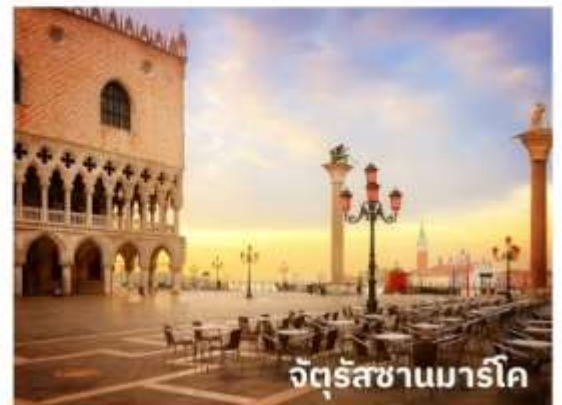
จัตุรัสซานมาร์โค

ท่านสามารถทำการสแกน QR CODE นี้ เพื่อรับชม เกาะเวนิส ในรูปแบบวิดีโอ