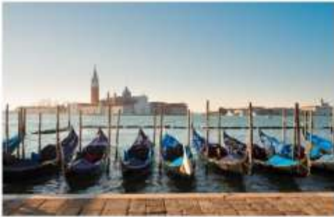
เรือกอนโดล่า

นำท่านออกเดินทางสู่ ท่าเรือตรอนเคโต เพื่อเตรียมตัวนั่งเรือข้ามสู่เกาะเวนิส เกาะเวนิสเป็นดินแดนแสนโรแมนติก เป็นเมืองที่ไม่เหมือนใคร โดยใช้เรือแทนรถ ใช้คลองแทนถนน มีสมญานามว่าเป็น “ราชินีแห่งทะเลเอเดรียติก” มีเกาะน้อยใหญ่กว่า 118 เกาะและมีสะพานเชื่อมถึงกัน กว่า 400 แห่ง