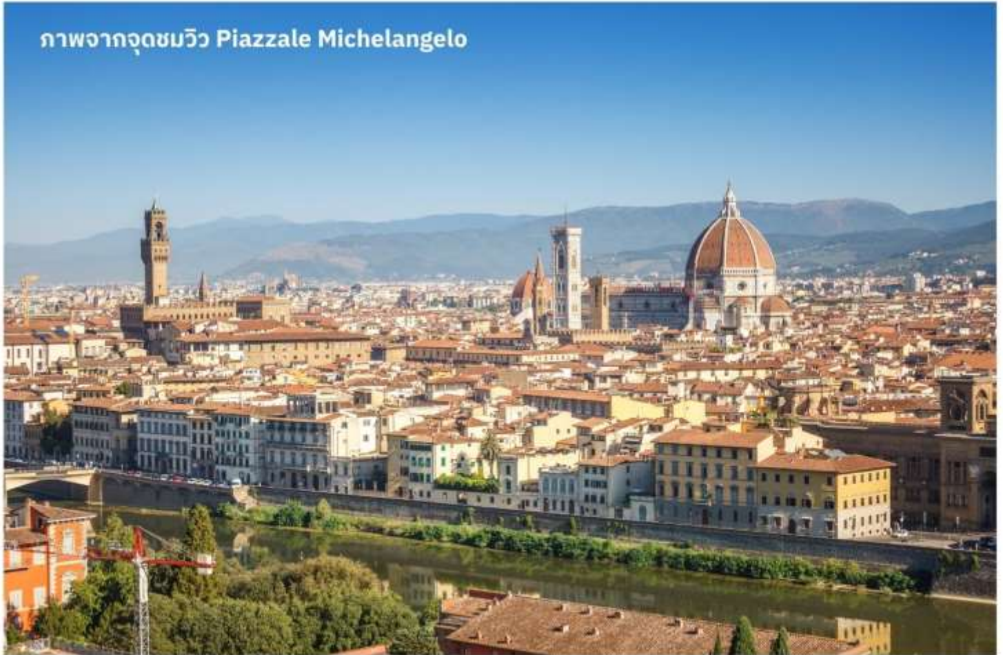
ภาพจากจุดชมวิว Piazzale Michelangelo

เมืองฟลอเรนซ์ ตั้งอยู่ทางตอนเหนือของประเทศอิตาลี เป็นเมืองที่มีชื่อเสียงในช่วงศตวรรษที่ 13-14 ซึ่งเป็นยุคที่เจริญรุ่งเรืองของวัฒนธรรมและศิลปะ อีกทั้งในอดีตยังมีความสำคัญทางการค้าและวัฒนธรรม มีสถาปัตยกรรมที่งดงามและเป็นที่มาของศิลปะโรแมนติกที่เจริญรุ่งเรืองอย่างมากในยุคนั้น นำท่านเดินทางไปยังเนินเขา Piazzale Michelangelo เพื่อชมวิวของเมือง Florence ที่นักท่องเที่ยวรวมไปถึงชาว Florence เอง มักขึ้นมาชมบรรยากาศในมุมสูงของเมือง ซึ่งจะเห็นหลังคาสีแดงของอาคารบ้านเรือนต่างๆ รวมไปถึง Duomo เรียงรายกันเป็นแนวสวยงามยิ่งนัก อีสาระให้ท่านเก็บภาพประทับใจตามอัธยาศัย