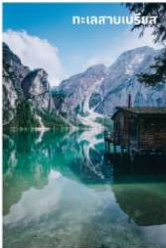
ทะเลสาบเบรียส

บริการอาหารกลางวัน ณ ภัตตาคาร นำท่านเดินทางสู่ ทะเลสาบเบรียส (Lake Braies) หรือ (Pragser Wildsee) ใช้เวลาเดินทางประมาณ 40 นาที เป็นทะเลสาบที่ได้ขึ้นชื่อว่าไข่มุกแห่งโดโลไมท์ ตั้งอยู่ในหุบเขาโดโลไมท์และยังได้เป็นส่วนหนึ่งในมรดกโลก (Unesco) อีกด้วย