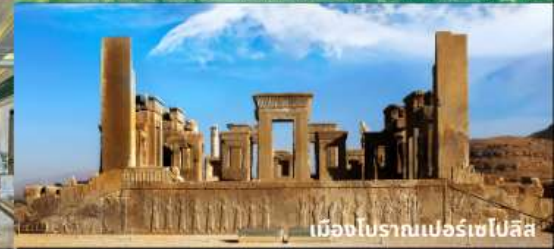
เมืองโบราณเปอร์เซโปลิส