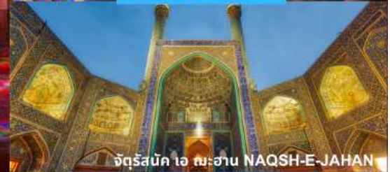
จัตุรัสบิก ไอ ฉะฮาน NAQSH-E-JAHAN