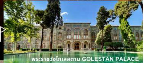
พระราชวังโกเลสถาน GOLESTAN PALACE