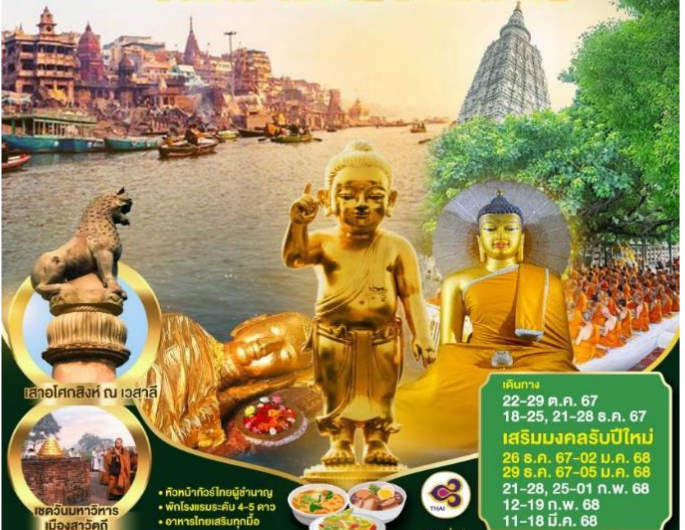
เสาชิงช้า ณ เวสาลี