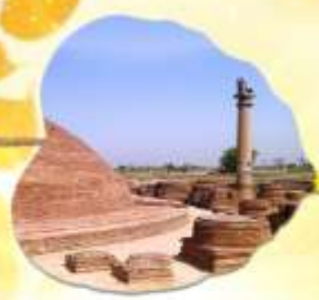
เมืองหลวงแคว้นอานาจักรวัชชี แคว้นชมพูทวีป