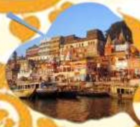
พาราณสี เมืองหลวงทางจิตวิญญาณภาคอินเดีย