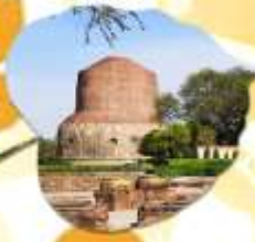
กุสินารา สถานที่ปรินิพพาน