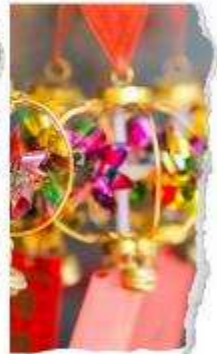
วัดแขกหมิว

นำท่านขอพรเพื่อเป็นสิริมงคล วัดแห่งนี้เป็นวัดที่คนฮ่องกงให้การเคารพนับถือเป็นอย่างมาก เป็นวัดเก่าแก่ และมีชื่อเสียงที่สุดวัดหนึ่งของฮ่องกง เป็น 1 ในวัดของฮ่องกงที่ทุกท่านห้ามพลาดเลยก็เดียว