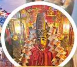
วัดลิมฟ้า