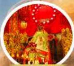
เจ้าแม่ทวนอิมฮองฮ่า