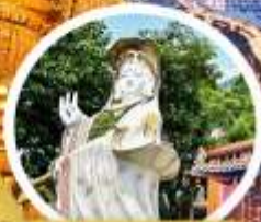
เจ้าแม่ทวนอิม รัชกาลที่ ๗