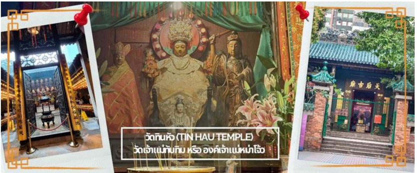
วัดทินหัว (TIN HAU TEMPLE) วัดเจ้าแม่ทับทิม หรือ องค์เจ้าแม่ทับทิม

จากนั้นนำท่านเดินทางสู่ วัดหลินฟ้า (LIN FA KUNG TEMPLE) หรือ วัดดอกบัว เป็นวัดจีนตั้งอยู่บริเวณ หวานจ้าย คอสเวย์เบย์ มีเจ้าแม่กวนอิม เป็นองค์ประธานของวัด สร้างขึ้นในปี 1863 มีตำนานเล่าว่า เจ้าแม่กวนอิมเคยปรากฏกายที่วัดแห่งนี้ เป็นที่เลื่อมใสของชาวบ้าน จึงร่วมใจกันสร้างวิหารลักษณะ คล้ายดอกบัวนี้ขึ้น และประดับด้วยโคมไฟดอกบัวร้อยโคม เมื่อมองเข้าไปด้านในวิหารจะทำให้รู้สึกถึงความเจริญรุ่งเรือง เปรียบเสมือนว่าแค่มาไหว้เจ้าแม่กวนอิมที่วัดแห่งนี้ก็ทำให้ผู้มาเยือนได้มีชีวิตที่ เจริญรุ่งเรืองยิ่งขึ้นไป และยังมี เทพเจ้าสาวจื่อเอี้ยะ (เทพเจ้าสายนรก) เป็นเทพที่ขึ้นชื่อเรื่องความ กตัญญู และด้านเงินทอง ผู้ใดที่ได้ไปไหว้ขอพรท่าน เชื่อว่าจะทำให้มีโชคลาภแบบไม่คาดคิด และสมหวัง อย่างรวดเร็ว ใครที่ชอบเสี่ยงโชค เสี่ยงดวง ห้ามพลาดเลยทีเดียว