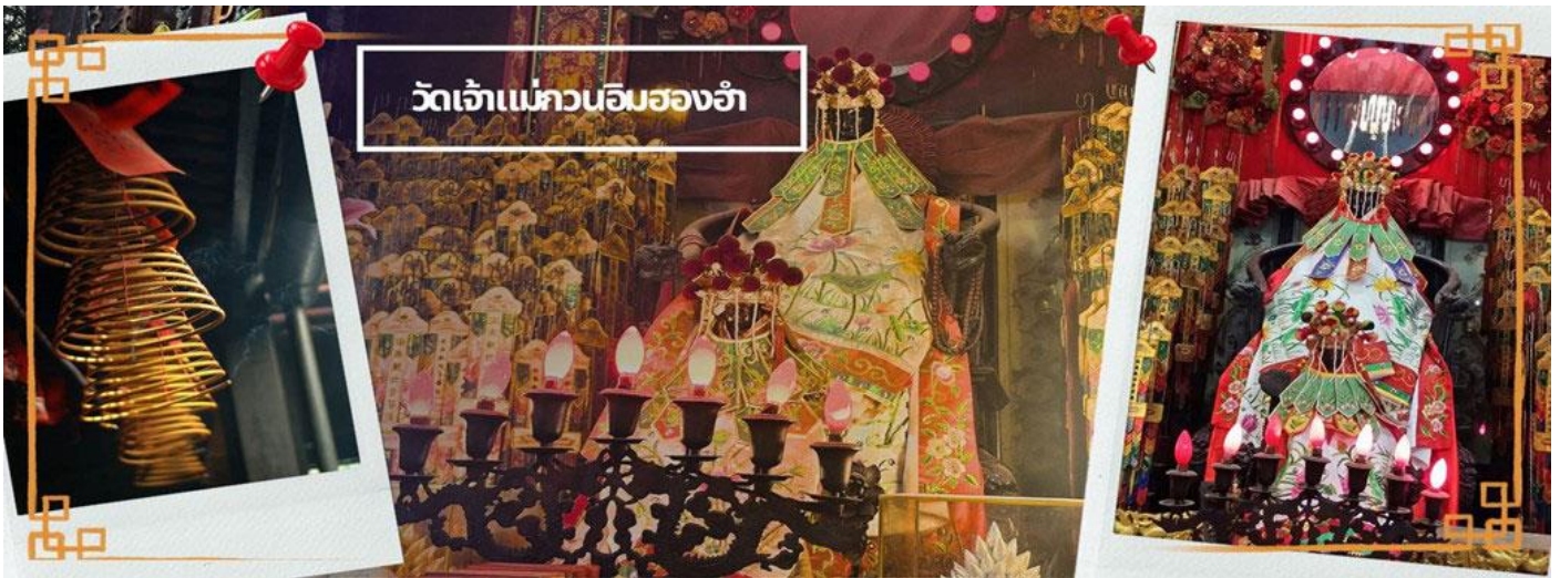
วัดเจ้าแม่กวนอิมสองอำ

จากนั้นนำท่านชม โรงงานจิวเวอรี ซึ่งเป็นโรงงานที่มีชื่อเสียงที่สุดของฮ่องกงในเรื่องการออกแบบเครื่องประดับ อาทิเช่น จี้ และแหวนกั้งหัน ที่สวยงามโดดเด่นไม่เหมือนใคร ซึ่งถือกำเนิดขึ้นที่นี่และมีชื่อเสียงที่สุดใช้เป็นเครื่องประดับติดตัว และเสริมดวงชะตา สินค้าทุกชิ้นมีเอกสารรับประกันคุณภาพเปลี่ยน ซ่อม ได้ตลอดอายุการใช้งาน หากเกิดการชำรุดจากสินค้าไม่ใช่อุบัติเหตุ และนำท่านเลือกซื้อเครื่องประดับที่ ร้านหยก ซึ่งคนจีนนั้นถือว่าหยกเป็นหิน ที่เป็นตัวแทนของความสวยงามและความเป็นสิริมงคล มีความเชื่อว่าหยกมงคล ถ้าพกติดตัวไว้จะอายุยืนและสุขภาพดี