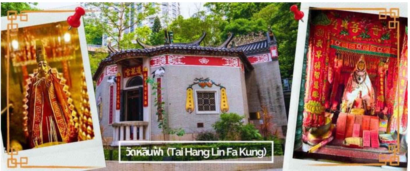
วัดหลินฟ้า (Tai Hang Lin Fa Kung)

จากนั้นนำท่านเดินทางสู่ วัดหลินฟ้า (LIN FA KUNG TEMPLE) หรือ วัดดอกบัว เป็นวัดจีนตั้งอยู่บริเวณ หวานจ้าย คอสเวย์เบย์ มีเจ้าแม่กวนอิม เป็นองค์ประธานของวัด สร้างขึ้นในปี 1863 มีตำนานเล่าว่า เจ้าแม่กวนอิมเคยปรากฏกายที่วัดแห่งนี้ เป็นที่เลื่อมใสของชาวบ้าน จึงร่วมใจกันสร้างวิหารลักษณะ คล้ายดอกบัวนี้ขึ้น และประดับด้วยโคมไฟดอกบัวร้อยโคม เมื่อมองเข้าไปด้านในวิหารจะทำให้รู้สึกถึงความเจริญรุ่งเรือง เปรียบเสมือนว่าแค่มาไหว้เจ้าแม่กวนอิมที่วัดแห่งนี้ก็ทำให้ผู้มาเยือนได้มีชีวิตที่ เจริญรุ่งเรืองยิ่งขึ้นไป และยังมี เทพเจ้าสาวจื่อเอี้ยะ (เทพเจ้าสายนรก) เป็นเทพที่ขึ้นชื่อเรื่องความ กตัญญู และด้านเงินทอง ผู้ใดที่ได้ไปไหว้ขอพรท่าน เชื่อว่าจะทำให้มีโชคลาภแบบไม่คาดคิด และสมหวัง อย่างรวดเร็ว ใครที่ชอบเสี่ยงโชค เสี่ยงดวง ห้ามพลาดเลยทีเดียว