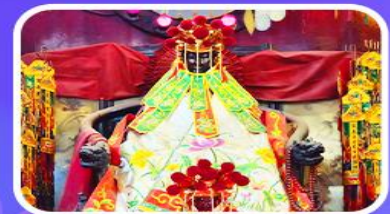
วัดเจ้าแม่กวนอิมสองฮ่า