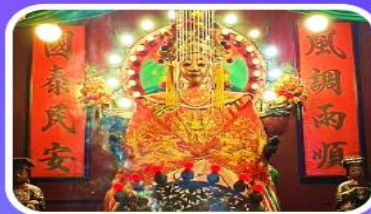
วัดเจ้าแม่กวนอิมเทียนหัว