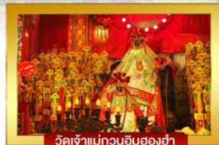
วัดเจ้าแม่กวนอิมฮองฮ่า