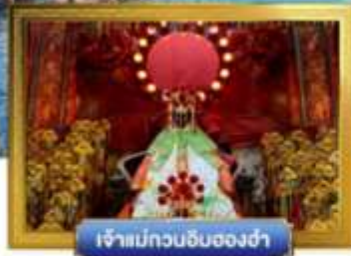
เจ้าแม่กวนอิมสองซ่า