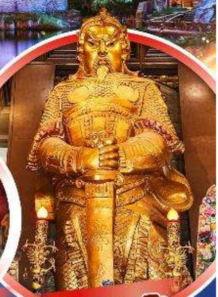
วัดเขกงทมือ