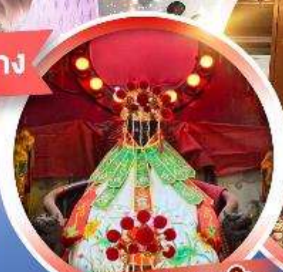
เจ้าแม่กวนอิมสองอ่า