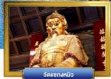
วัดเข่งทิว