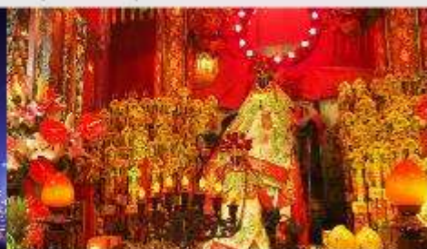
วัดเจ้าแม่กวนอิมของซ่า

*ทางบริษัทฯ ขอสงวนสิทธิ์ในการสลับโปรแกรมทัวร์ตามความเหมาะสมขึ้นอยู่กับสถานการณ์ปัจจุบัน โดยคำนึงถึงผลประโยชน์ของลูกค้าเป็นสำคัญ