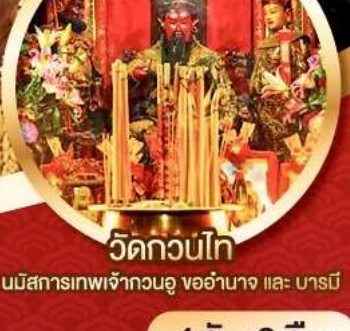
วัดกวนไท่

นมัสการองค์เจ้าแม่กวนอิม อายุกว่า 600 ปี