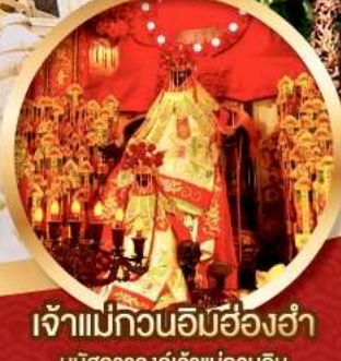
เจ้าแม่กวนอิมสี่องค์

นมัสการองค์เจ้าแม่กวนอิม อายุกว่า 600 ปี