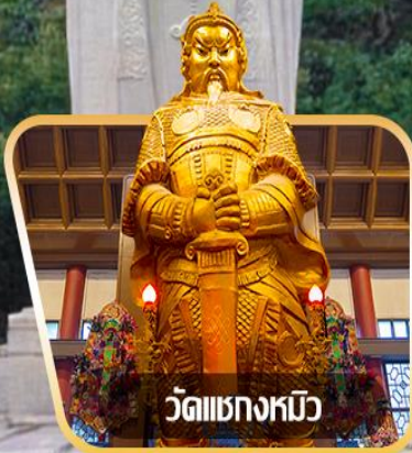
วัดเขangkงมียว