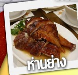
ก้านย่าง