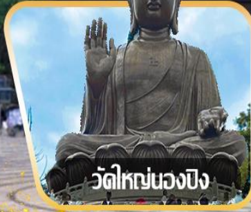
วัดใหญ่หนองปิง