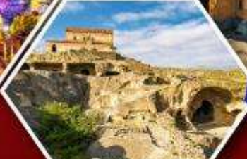
เมืองดำอพิลิสต์ซเคห์