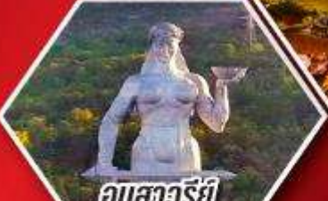
อนุสาวรีย์