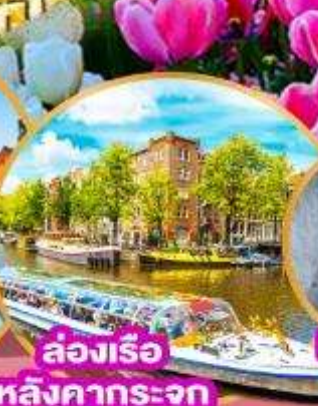
ล่องเรือ หลังคากระจุก