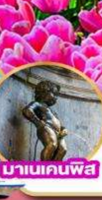
มานเคนพิส