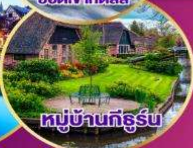
หมู่บ้านก็ธูร์น