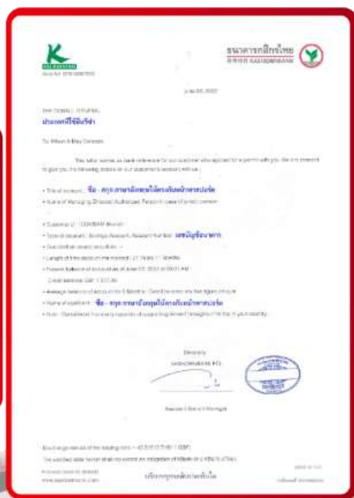
ตัวอย่าง Bank Guarantee ที่ผู้สมัครต้องขอกับธนาคาร