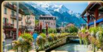
เยือนซาโมเน็กซ์ พิชิตมงบลังค์