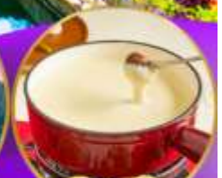
ฟองดูชีส