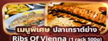
เมนูพิเศษ ปลาเทราต์ย่าง Ribs Of Vienna (1 rack 500g)

กาสิโน 15 ท่านออกเดินทาง พร้อมหัวหน้าทัวร์คนไทย