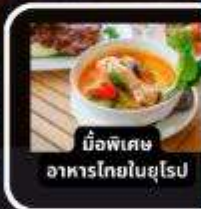
มือพิเศษ อาหารไทยในยุโรป