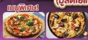
เมนูพิเศษ!