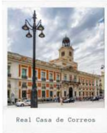
Real Casa de Correos