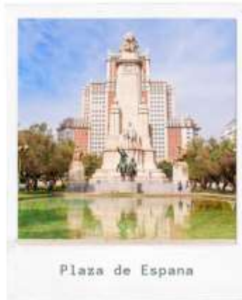
Plaza de Espana