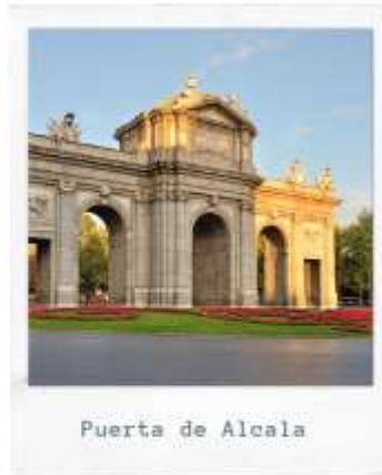
Puerta de Alcala

แล้วไปชม ปลaza เดอ เอสปันญา (Plaza de Espana) ชมอนุสาวรีย์เซอร์แวนเตส กวีเอกชาวสเปน ที่ตั้งอยู่เหนืออนุสาวรีย์ตอนกิโมเต้ในสวนสาธารณะ นำเที่ยวชมสถานที่สำคัญของกรุงแมดริด น้ำพุไซเบเลส ที่สร้างอุทิศให้แก่เทพริดาไซเบ ลีน อาคารสวยงามใกล้ๆ กันคือ ที่ทำการไปรษณีย์, ประตูชัยอาคาล่า, ปลaza มา ยอร์ จัตุรัสสำคัญ ของกรุงมาดริด, ตลาดซันมีเกล ปัจจุบันย่านนี้เป็นถนนคนเดิน เต็ม ไปด้วยร้านกาแฟน่ารัก, ปูเอต้า เดล ซอล หรือประตูพระอาทิตย์ จัตุรัสใจกลางเมือง จุดนับ กิโลเมตรแรกของสเปน และยังเป็นจุดตัดของถนนสายสำคัญของเมืองที่หนาแน่นด้วยร้าน ค้ามากมาย และห้างสรรพสินค้าขนาดใหญ่ El Corte Ingles