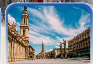
จัตุรัสพลาซ่า เดล พาร์