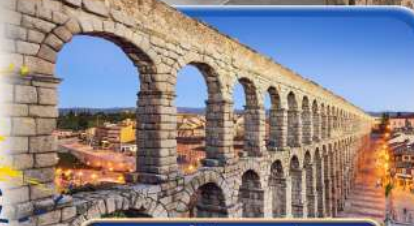
รางส่งน้ำโรมัน เซโกเวีย

สายการบินสัญชาติสเปน X บินตรง Full Service