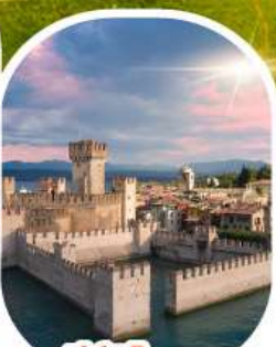
ซิริมิโอเน