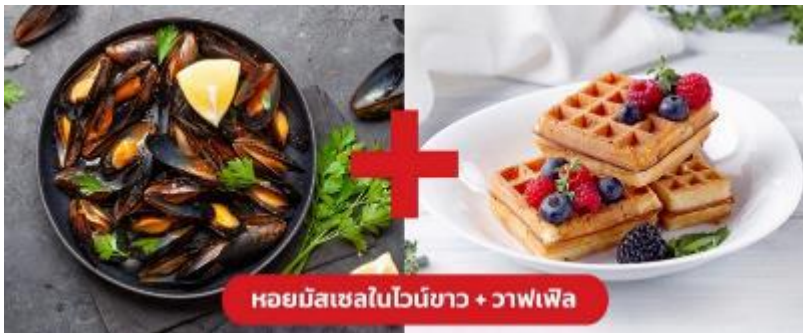
หอยมัสเซลไวน์ขาว + วาฟเฟิล

เย็น 🍷 รับประทานอาหารเย็น (มือที่10) เมนูพิเศษ!! หอยมัสเซล + วาฟเฟิล (Mussel in White wine + Waffle)