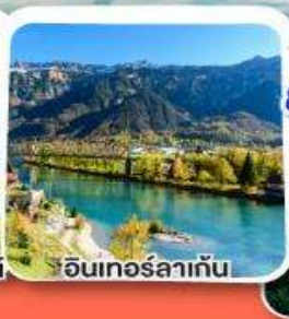
อินเทอร์ลาเก็น