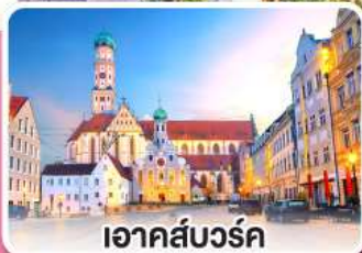
เอาคส์บวร์ค