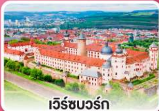
เวิร์ชบวร์ค