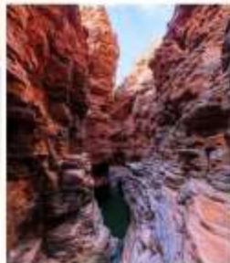
แกรนด์แคนยอนยูลาโกว