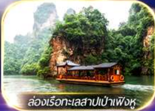
ล่องเรือทะเลสาบเป่าเฟิงหู