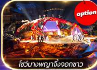
โชว์นางพญาจิ้งจอกขาว