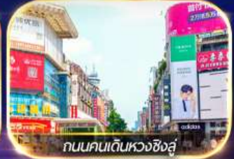
ถนนคนเดินหวงซิงสู่

ล่องเรือชมเมืองโบราณ ฟุรงเจิน + ทะเลสาบเป่าเฟิงหู