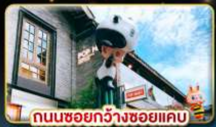
ถนนชอยกว้างชอยแคบ