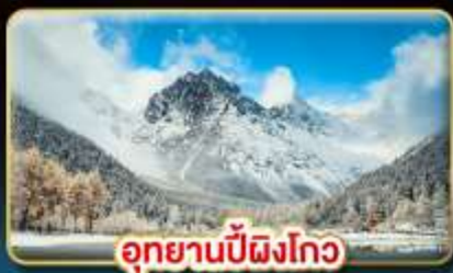
อุทยานปี้ผิงโกว