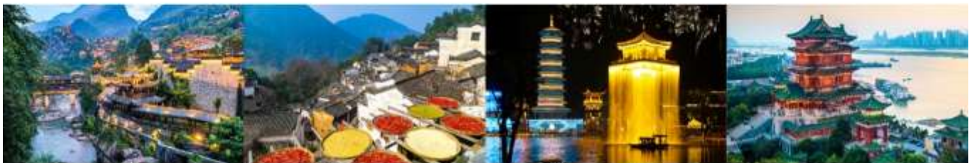
หุบเขาเทวดาฉีเจียนกู่