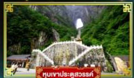
อุทยานประตูสวรรค์