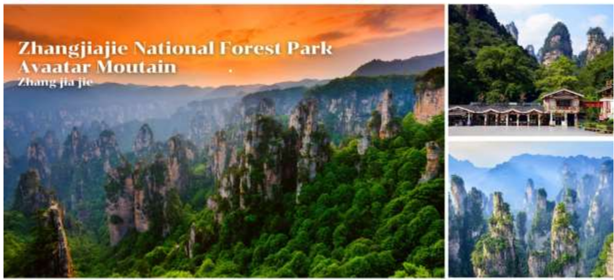
Zhangjiajie National Forest Park Avatar Mountain Zhang jia jie

🍴 รับประทานอาหารกลางวัน มื้อที่ 2 #ภัตตาคารอาหารท้องถิ่น ✓