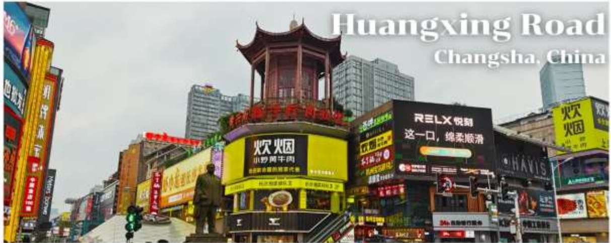
Huangxing Road Changsha, China

🍴 รับประทานอาหารเช้า มื้อที่ 10 # โรงแรม ✓