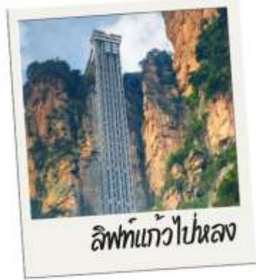
ลิฟท์แก้วไปหลง