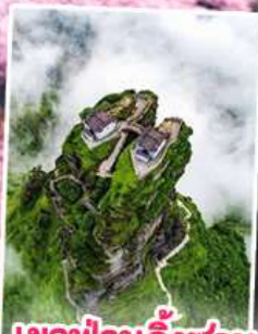
อุทยานกุหลาบพันปี หมู่บ้านแม่วชิเจียง