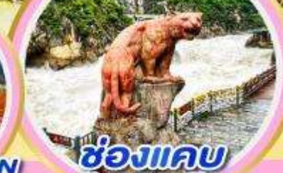
ช่องแคบ เสือกระโจน