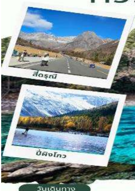
สี่ดรุณี