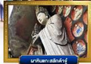
ผาหินแกะสลักคำจู้