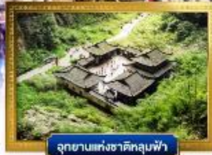
อุทยานแห่งชาติหลุมฟ้า