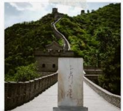
กำแพงเมืองจีน ด่านจวิหยงกวน