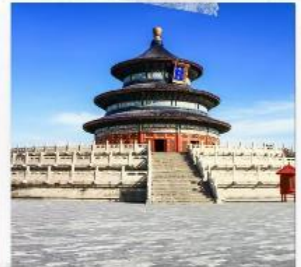
หอบูชาเทียนถาน