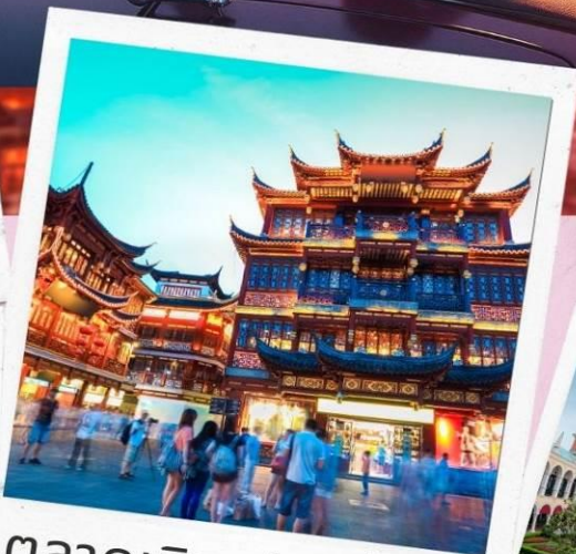
ตลาดเจิ้งหวังเหมี่ยว