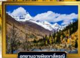
อุทยานฉางผิงเวาสีครุณี