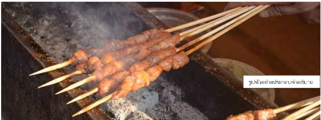
รูปตัวอย่างประกอบคำอธิบาย

เพิ่มพิเศษ เมนูหมูปิ้งย่างหมาล่า ท่านละ 5 ไม้เล็ก