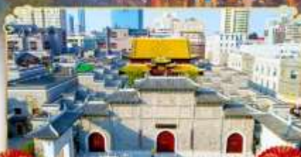
ถนนโบราณวั้งโซ่กวง