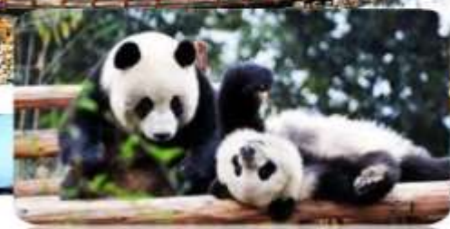
ศูนย์วิจัยหมีแพนด้า

เมนูพิเศษ สุกี้หม่าล่า บุฟเฟ่ต์ / เปิดชกก๊อง