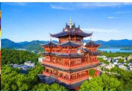
หอเจิ้งหวงเก๋อ