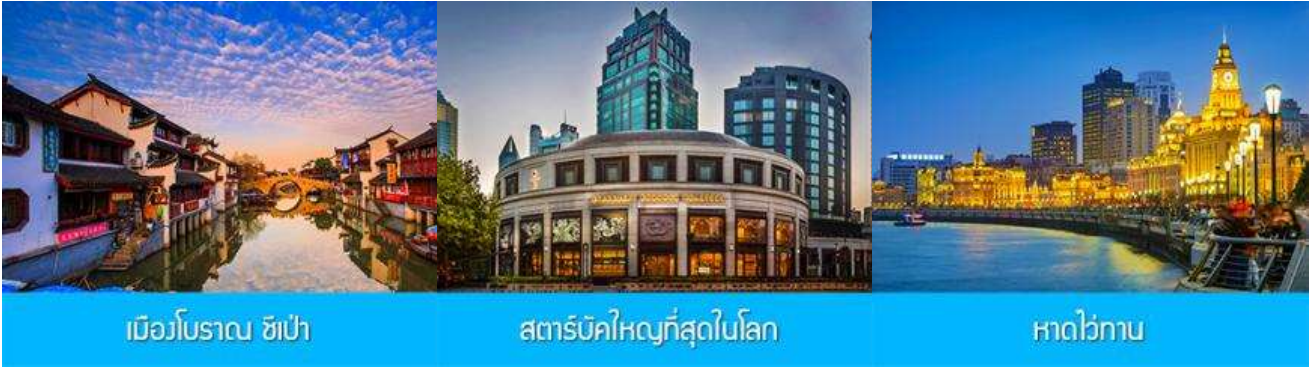
เมืองโบราณ ซิเป่า