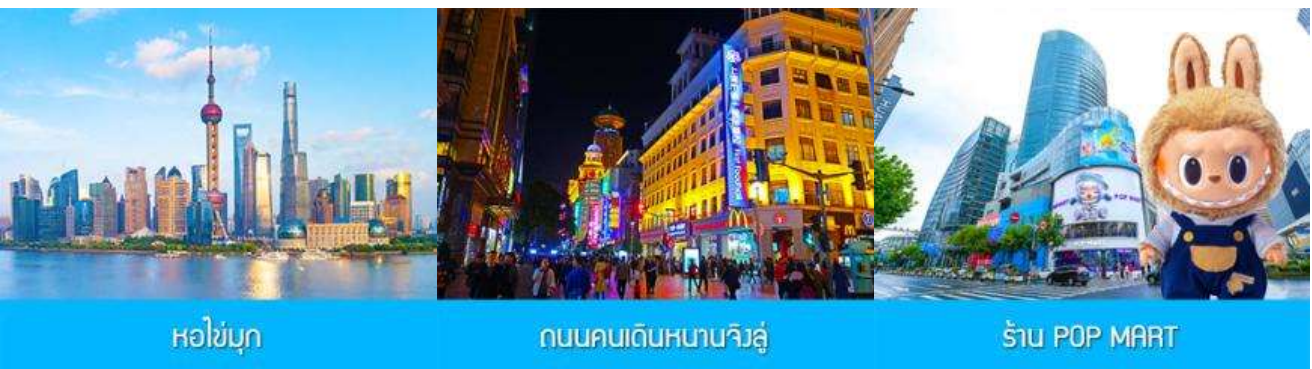
หอไข่มุก