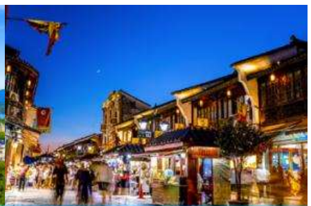
ย่านเหอฝางเจีย

วันที่สี่ นครเซี่ยงไฮ้ –เมืองหังโจว-ล่องเรือทะเลสาบซีหู-หอเจิ้งหวงเก๋อ-ย่านเหอฝางเจีย- ช้อปปิ้ง Outlet –เดินทางไปสนามบิน