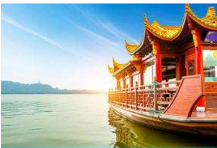
ล่องเรือทะเลสาบซีหู

พักที่ โรงแรม Heyi Hotel or Holiday Inn Express Hotel 4* หรือเทียบเท่าในเมืองเซี่ยงไฮ้