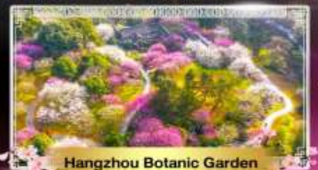
Hangzhou Botanic Garden