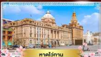
หาดไถ่ทาน

"ชมดอกซากุระนลิบาน ณ แดนมังกร" ล่องเรือทะเลสาบตะวันตก ไข่มุกแห่งหางโจว