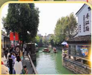
ท่องเที่ยวโบราณผิงเจียง

5 - 9 ก.พ. 2025 19-23 ก.พ. 2025 26 ก.พ.-2 มี.ค. 2025