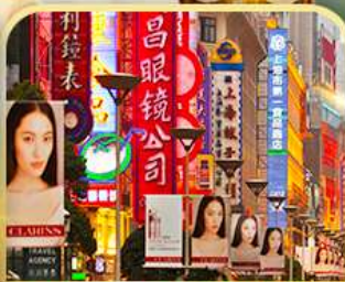
เดินเล่นถนนหนานจิง