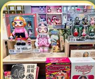
Popmart หังหุปุ่น อิน77