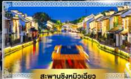
สะพานชิงหมิงเจียว