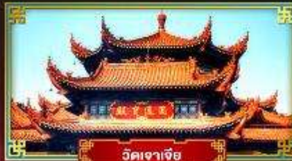
วัดเจาเจีย