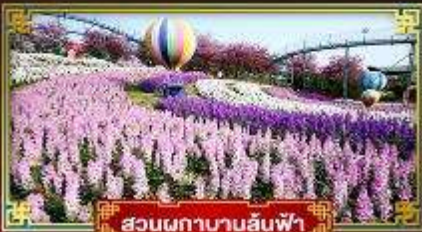
สวนพฤกษานานสันฟ้า