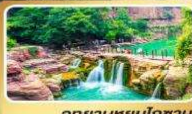
อุทยานหยุ่นโกซ่าน