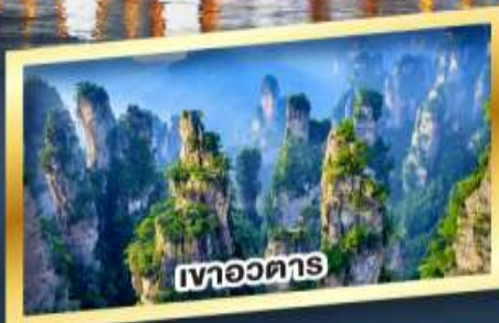
เขาอวดาร